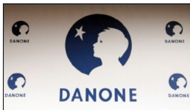
Logo de Danone

Voir aussi : Procès alimentation industrie social prudhommes